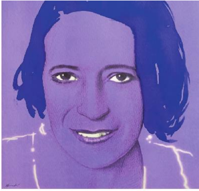
Aurora Bertrana Avui us parlaré Conferències (1930-1967)